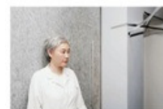
Lee Bul